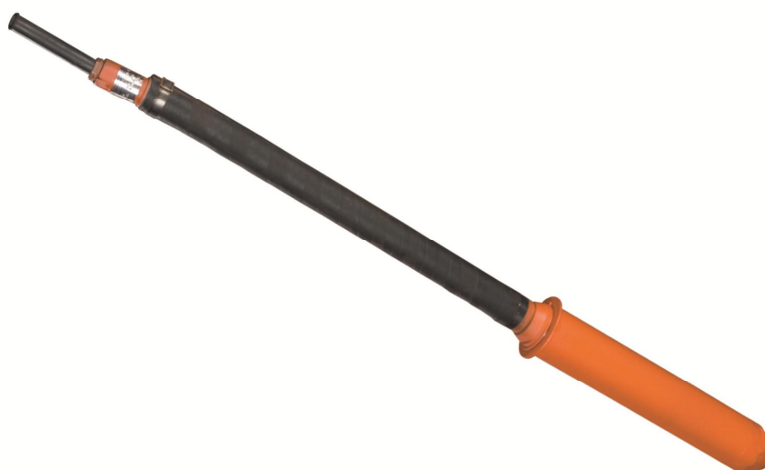
Рисунок 1. Вибратор электрический глубинный подвесной ИВ – 95А.

Система менеджмента качества ОАО «Ярославский завод «Красный Маяк» сертифицирована органом по сертификации DQS, Германия, который является членом Международной сертификационной сети IQNet. Система соответствует требованиям Международного стандарта DIN EN ISO 9001:2000, регистрационный номер сертификата 071018 QM.