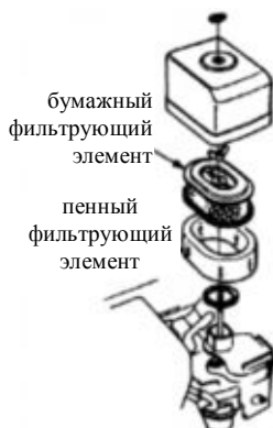
Рисунок 1. Воздушный фильтр