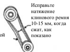
Рисунок 2. Натяжение клинового ремня

ВНИМАНИЕ НИКОГДА не пытайтесь проверить клиновой ремень при работающем двигателе. В случае попадания рук между клиновым ремнем и сцеплением возможны серьезные травмы. Всегда используйте защитные перчатки.