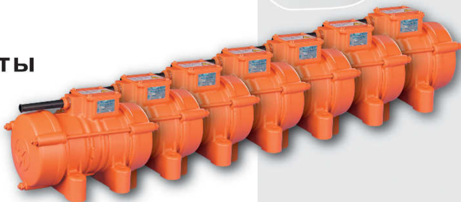
7 штук ИВ-98

*Конструкция и внешний вид запатентованы